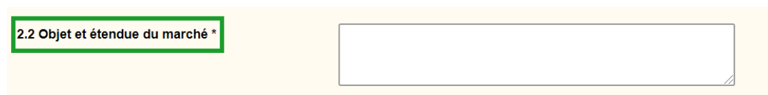
Figure: formulaire «Résumé» (OB05) après la modification

Le champ figure désormais dans le formulaire «Adjudication» (OB02) et « Révocation » (OB09).