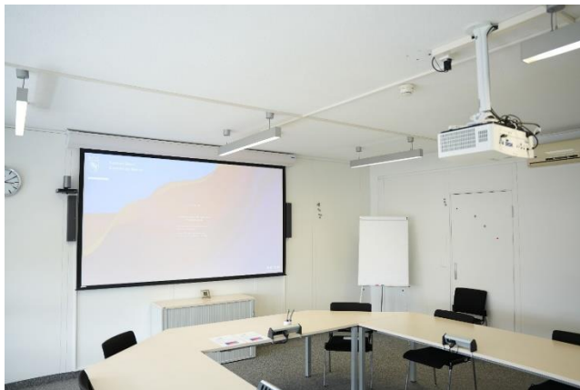
Sitzungszimmer mit Projektor